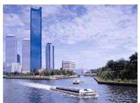
AQUA METROPOLIS OSAKA 2009