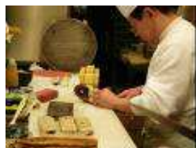
A Tasty Morning at Central Wholesale Market Osaka