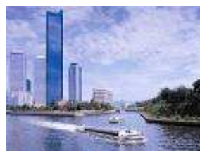
AQUA METROPOLIS OSAKA 2009